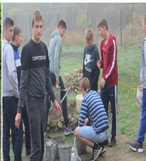
Акция «Каждой пичужке – кормушка»