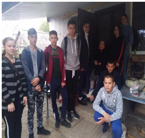
Акция «Школа- наш дом»